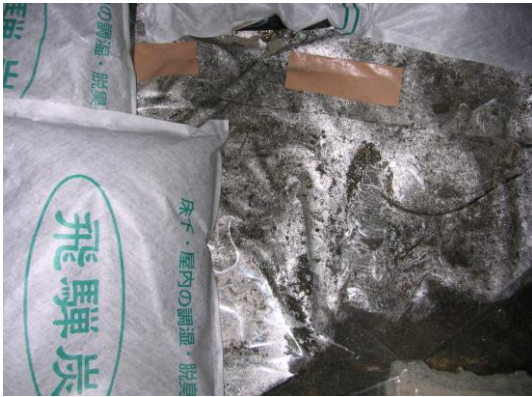
ビニールシート上の飛驒炭マット