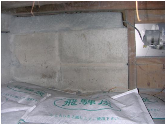
飛驒炭マットの床下風景