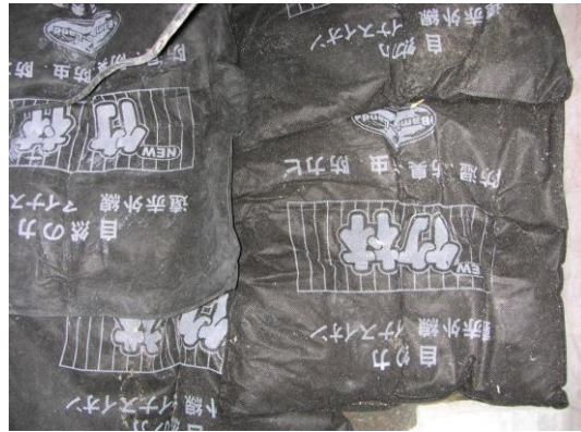
土壌の上に敷き詰めた竹炭マット