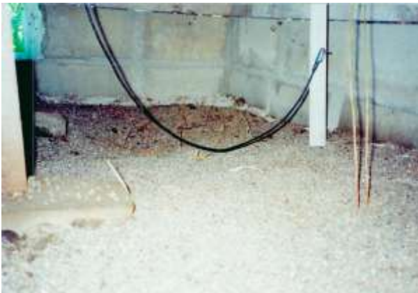
(セピオライト床下散布後風景)