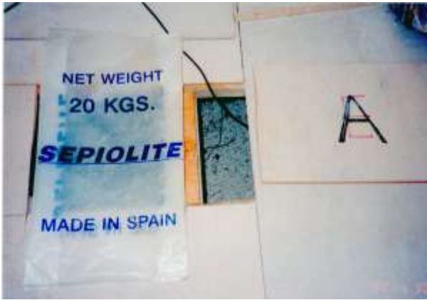
(セピオライトを床下に入れる)