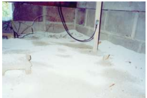
(Mカル床下散布後風景)