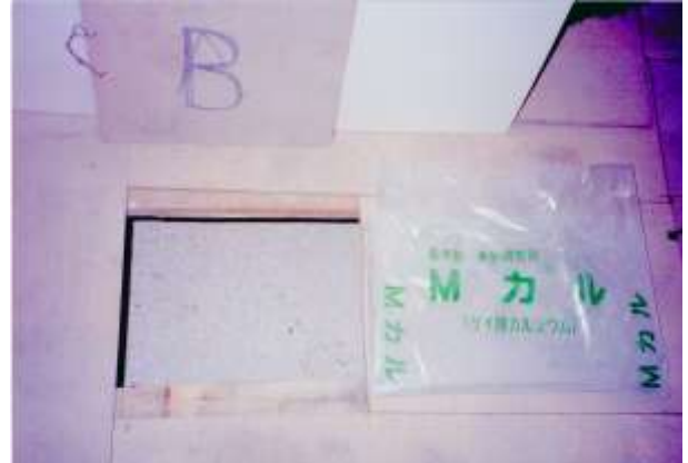
(Mカルを床下に入れる)